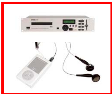
Lector de CD, lector MP3...